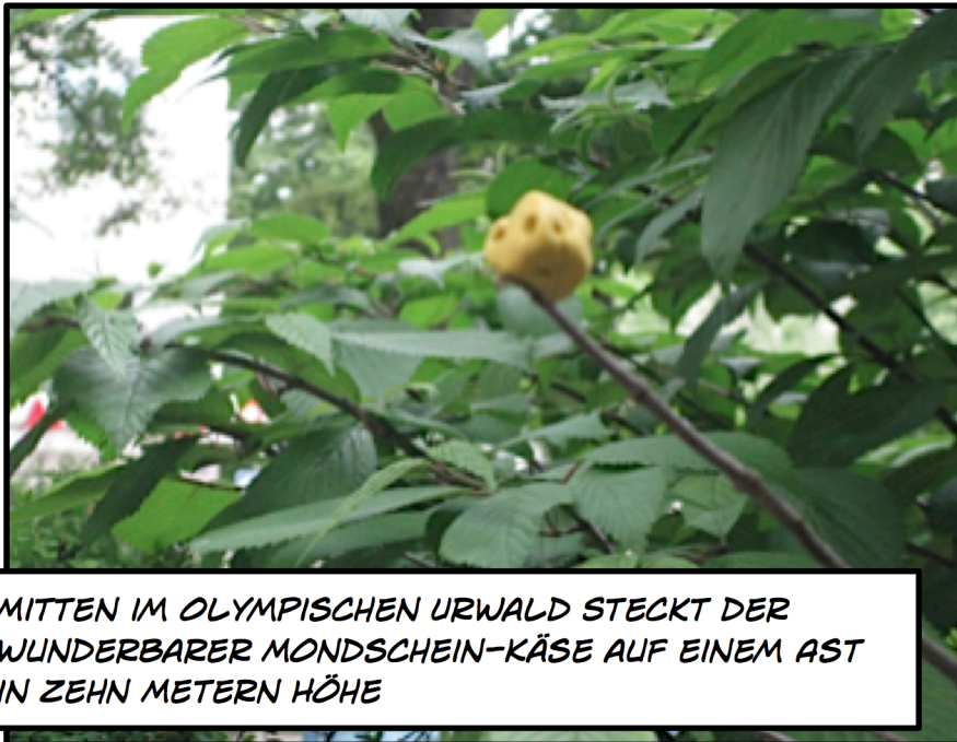
MITTEN IM OLYMPISCHEN URWALD STECKT DER WUNDERBARER MONDSCHHEIN-KÄSE AUF EINEM AST IN ZEHN METERN HÖHE

KLAR BIN ICH DA DABEI. DAS WIRD BESTIMMT EIN SPANNENDES ABENTEUER!